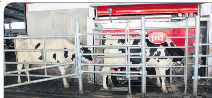
Ferme du Petit 5 mise sur quatre robots de traite Lely A4.

relève. Mais on pourra retransformer cette partie à moyen terme pour y loger des vaches laitières », explique Francis Bélanger. Pour ce faire, on réduira le cheptel de relève. Entrepris en août 2017, les travaux effectués à l'érection de la nouvelle étable se sont terminés en fin de juin dernier.